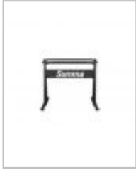
Pied pour plotter de découpe Summa S One - S1 D60