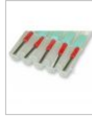
Summacut - Lot de 5 lames standard