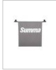
Panier de réception pour plotter de découpe Summa S One - S1 D60