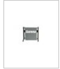
Pied avec panier pour plotter de découpe Summa S One - S1 D60